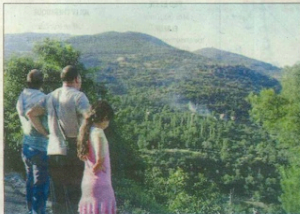
Des paysages magnifiques.