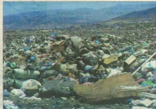
La décharge publique où plus de 40 tonnes/ jours de déchets sont jetés.