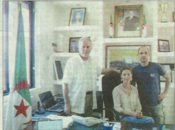
Les animateurs de la MJC reçu par le premier magistrat de la ville d'Akbou.

gion ont été explorées. Les invités ont pu découvrir le paysage magnifique de cette région montagneuse et sauvage au fort potentiel en terme de biodiversité. Et mesurer aussi le chemin à parcourir concernant notamment la gestion de la forêt et surtout celle de l'eau en raison de la problématique locale liée au fleuve « Soummam » : assèchement dû aux sablières, barrage à l'entrée d'Akbou, qualité de l'eau, décharge publique... Akbou est une ville connue pour sa zone d'activité. Des usines jaillissent comme des champignons mais les normes d'hygiène ne sont pas toujours respectées. Et puis il y a la gestion quasi inexistante des déchets. Les habitants n'ont pas encore le réflexe de déposer leurs déchets dans les poubelles... » Ne pouvant rester insensible à tous les déchets qui jonchaient le sentier allant de cap Carbon à la plage, les jeunes ont pris des sacs poubelles pour ramasser tous ses dé-