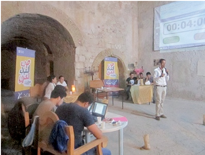
Confrontation entre deux équipes de débatteurs.

Les «débat show» sont de retour à Oran. Des groupes de débatteurs s'affrontent ainsi sur des thèmes d'actualité, avec pour seule arme : leurs pouvoir de persuasion.