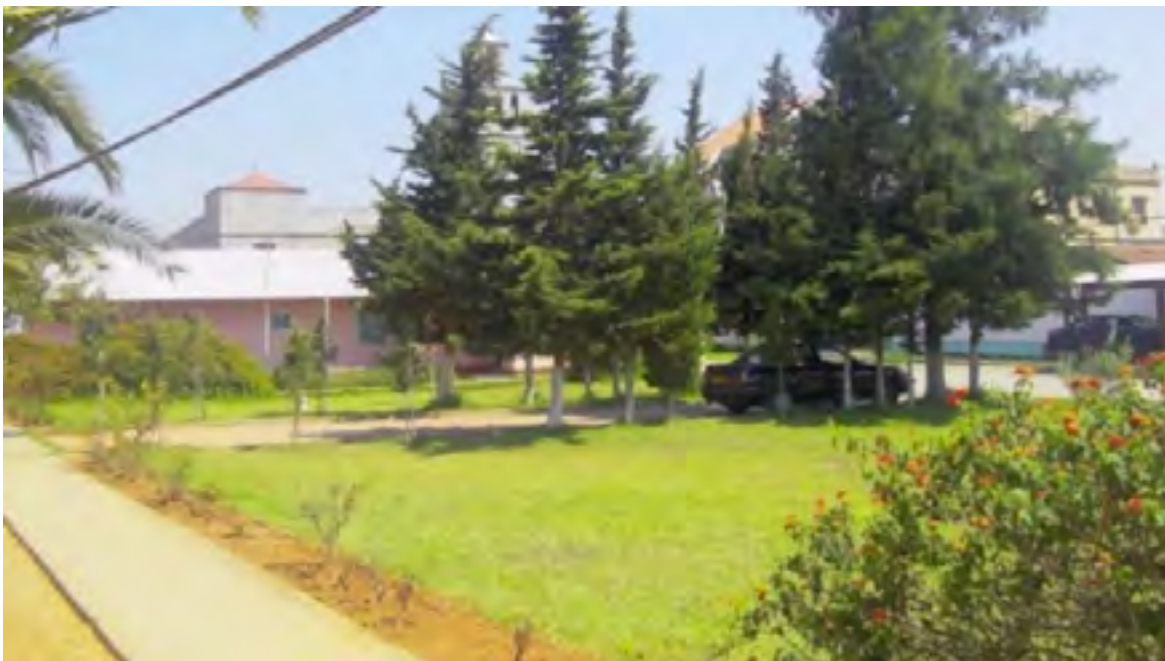
SOS VILLAGE D'ENFANTS DE DRARIA

La page Facebook de l'orphelinat « SOS Village d'Enfants de Draria » l'annonçait ce matin : la tentative d'évacuation des enfants hébergés dans le centre pour récupérer le terrain a été stoppée. TSA a contacté le chargé de communication de SOS Village d'enfants, Amine Bouzahri pour plus de précisions.