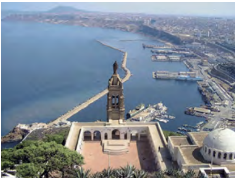
La chapelle Notre Dame de Santa Cruz

Une rencontre-débat sur la préservation et la sauvegarde de Notre Dame de Santa Cruz a été organisée, dans la matinée de mercredi, par la Chambre du Commerce et de l'Industrie de l'Oranie (CCIO).