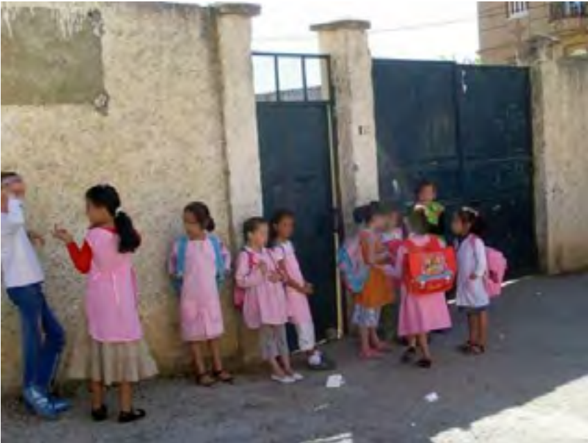
Les violences guettent les élèves

L'association des parents d'élèves de l'école Iffis Larbi a organisé, samedi dernier, en collaboration avec l'Etoile culturelle d'Akbou, une conférence-débat à la maison de jeunes A/Rahmane Farès sous le thème «climat scolaire et prévention des violences».