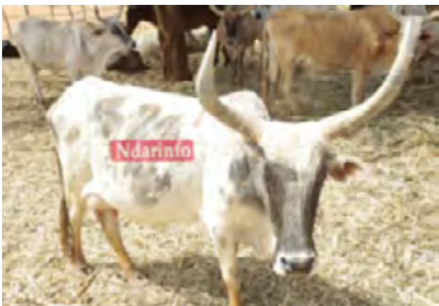
Dans l'enclos d'un éleveur de Dagana

Le Projet d'Accès aux services et structuration des éleveurs laitiers (ASSTEL) suscite une forte adhésion de la part des acteurs de ce secteur qui, au cours de la cinquième réunion du comité de pilotage de ce programme, vendredi à Richard TOLL, ont fortement plébiscité les actions menées par le GRET dans le cadre de la professionnalisation des fermiers locaux.