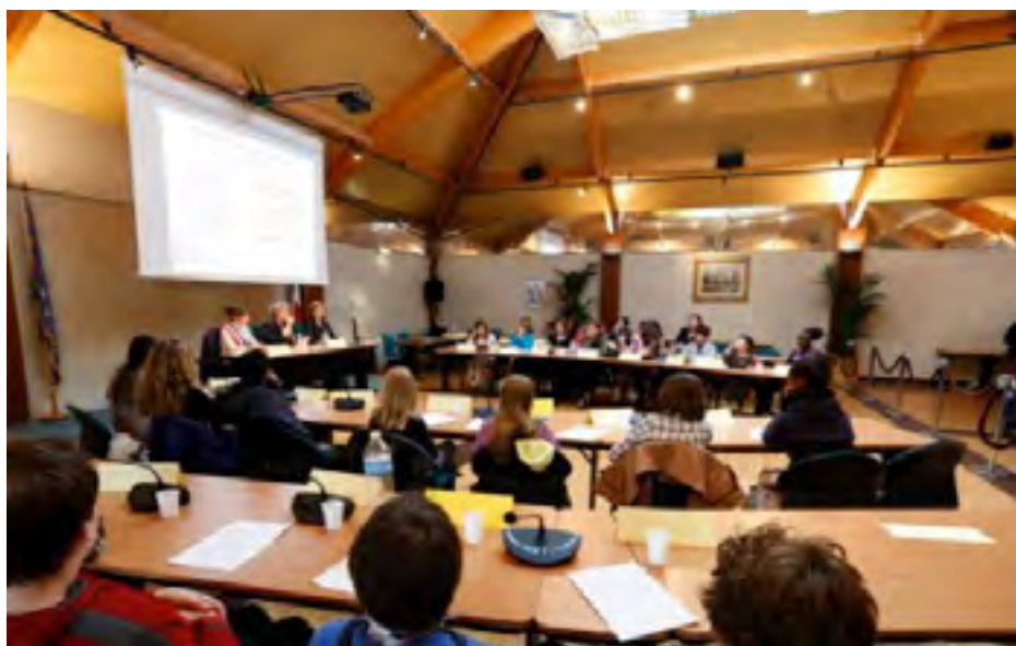
Guyancourt. Le conseil municipal des jeunes de Guyancourt a été récompensé pour sa carte de la ville.

Les conseils municipaux des jeunes de Guyancourt et de Voisins-le-Bretonneux ont été récompensés par l'association nationale des conseils d'enfants et de jeunes (Anacej) lors de la remise des Prix des Jeunes Citoyens 2015, organisée à Figeac (Lot). Ces Prix, mis en place depuis 2011, ont pour objectif la valorisation des jeunes et de leurs actions, menées dans les villes.