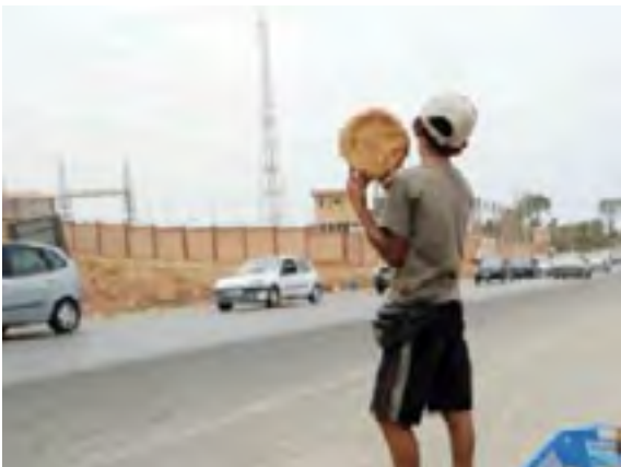
L'exploitation des enfants ne figure pas dans le projet de loi