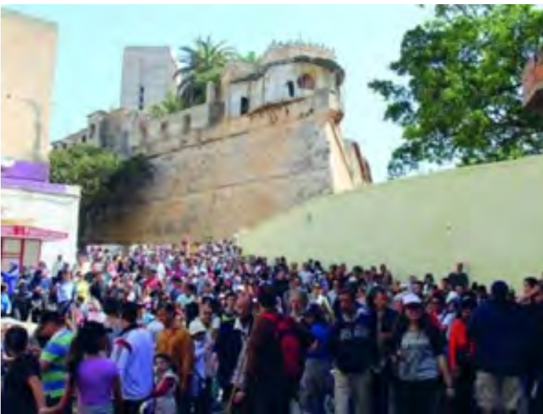
Grande promenade organisée à Oran dans le cadre du Mois du patrimoine

Cette année encore, dans le cadre du Mois du patrimoine, l'association Bel Horizon, en partenariat avec l'Institut français d'Oran, a organisé une manifestation grandiose le vendredi 1er mai, à laquelle a pris part un bon millier d'Oranais.