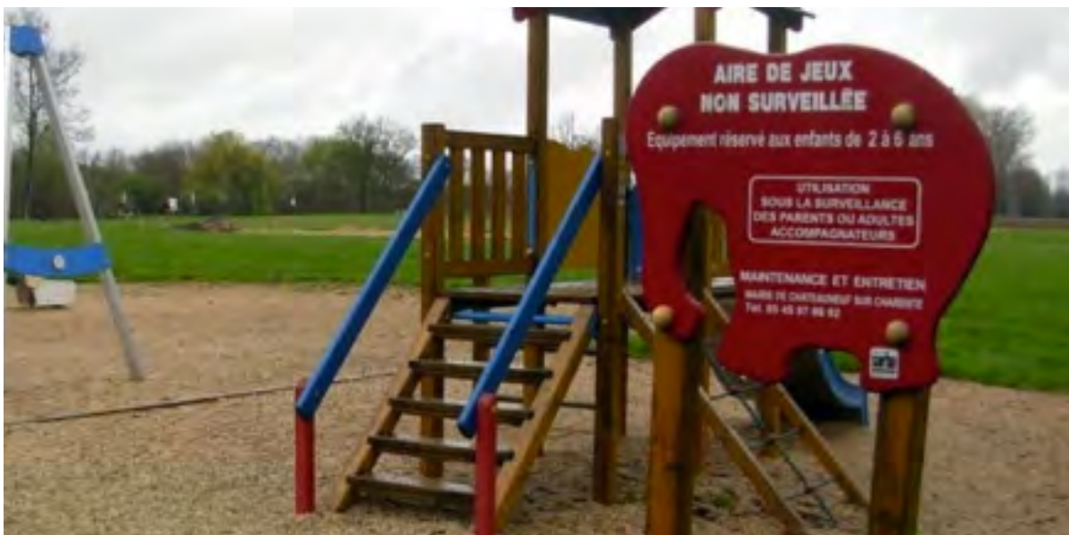
Le site du Bain des dames sera valorisé au cours de l'exercice 2015.

Le conseil municipal du 22 avril a adopté plusieurs décisions modificatives concernant des marchés en cours, ainsi que la réparation du sinistre de la piscine. Des autorisations pour solliciter des subventions institutionnelles, destinées aux projets en cours comme la valorisation du site du Bain des dames, ont été votées à l'unanimité.