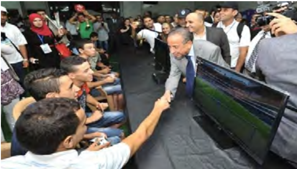
Khomri exhorte les directeurs de jeunesse à promouvoir la culture du dialogue

ALGER - Le ministre de la Jeunesse et des Sports, Abdelkader Khomri, a exhorté jeudi à Alger les directeurs de jeunesse au niveau des wilayas à promouvoir la culture du dialogue, pour une synergie et une concertation avec l'ensemble des jeunes dans la prise en charge de leurs attentes en vue de consolider la cohésion nationale.