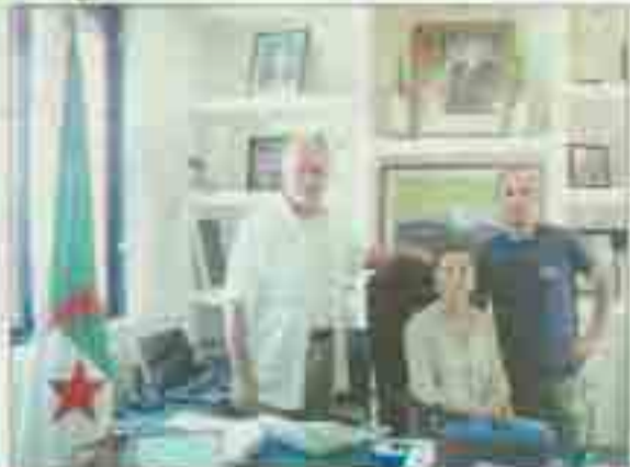
Les animateurs de la MJC avec les jeunes habitants de la ville d'Elbeuf.

Les animateurs de la MJC se sont rendus à Akbou (Algérie) et à Elbeuf (Allemagne) pour participer au projet « Jeunes écocitoyens ». Ils ont rencontré les responsables locaux et les jeunes habitants de la ville d'Elbeuf.