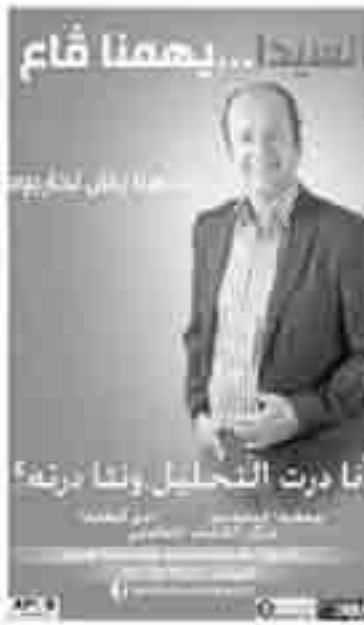
المتان معشر العلاج تارتد في المدينة.

والتسي وعبد المجلس الشعبي الولائي لوههران بأن يتم نشرها في المدينة، كما تلقت الجمعية وعدا