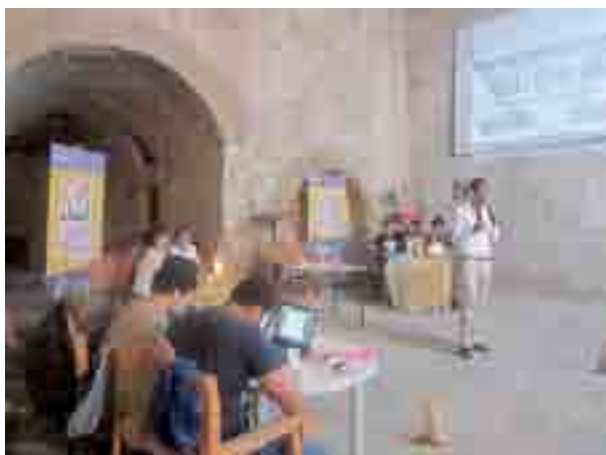
Confrontation entre deux équipes de débatteurs.

Les «débats show» sont de retour à Oran. Des groupes de débatteurs s'affrontent ainsi sur des thèmes d'actualité, avec pour seule arme : leurs pouvoir de persuasion.