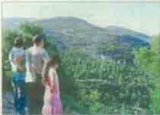
Les jeunes de la MJC lors d'une activité.

Deux jeunes Algériens ont été accueillis à la MJC d'Elbeuf. Ils ont participé à des ateliers de découverte de la culture allemande et ont rencontré les animateurs de la MJC.