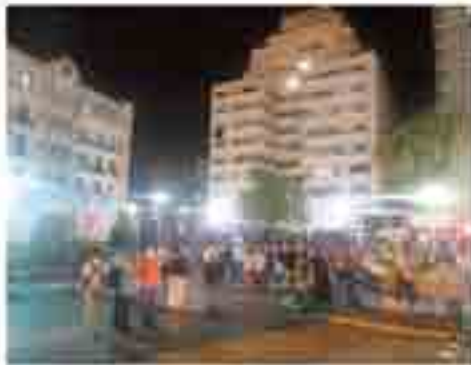
La fête de la musique célébrée

Cette année, les oranais ont décidé de célébrer comme il se doit la fête de la musique. Dès 18h, le square «port Saïd», au front de Mer, a été investi par un public nombreux, venu danser et chanter, dans une ambiance festive. Des oranais de tous les âges ont répondu présents à l'appel de Bel