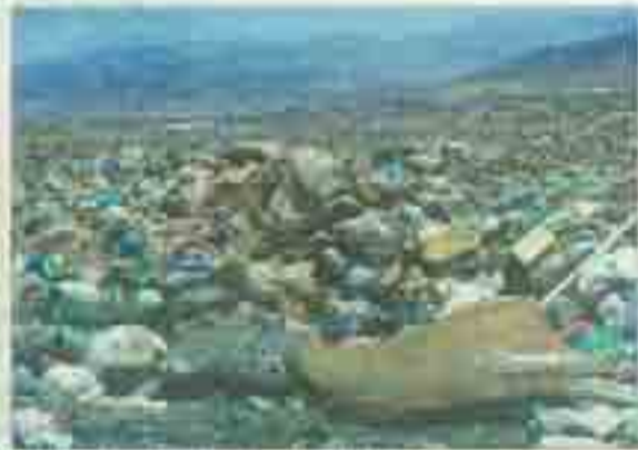
Un dépôt de déchets dans la région.