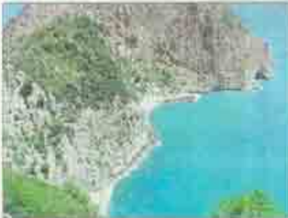
Une vue panoramique sur Akbou.